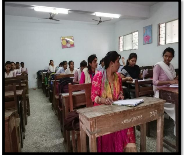
स्पर्धा परीक्षा क्षमता चाचणीला उपस्थित विद्यार्थिनी