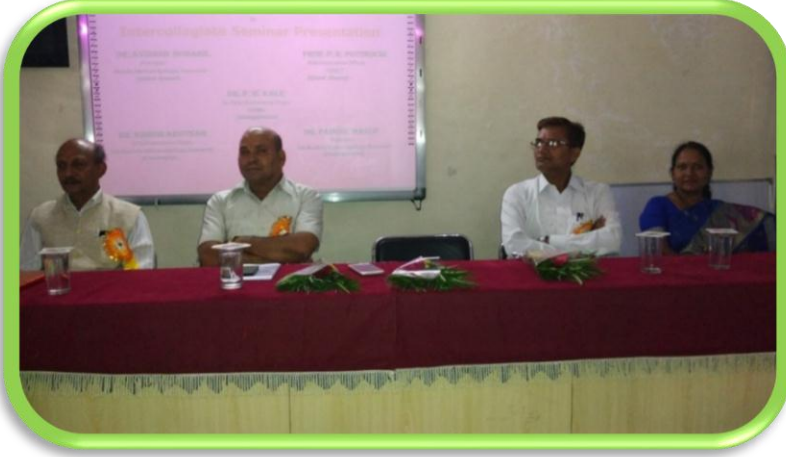
तक्षशिला महाविद्यालयाच्या व्यासपीठावर उपस्थित मान्यवर